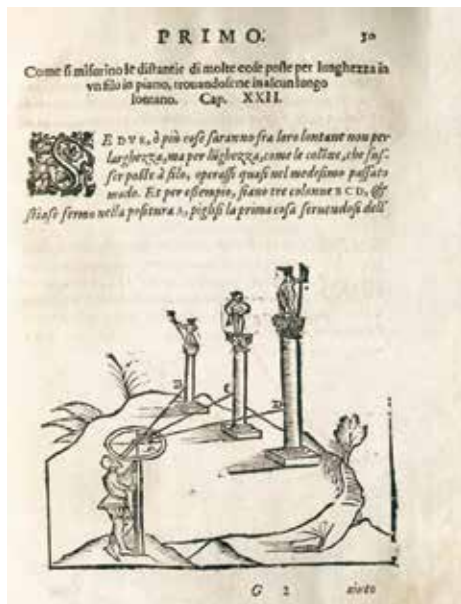
Cosimo Bartoli, Del modo di misurare... , Venice 1614

all photographs in this series are accompanied by captions stating the contemporary name of the location and the daily date). 18 Two years later, however, the place looks different, having become a huge construction site of one of the stations of Warsaw's second metro line. All tenants of the prewar tenements as well as of the adjacent office and residential extensions erected in the 1990s have been (despite loud protests) evicted, and a new office building is being erected on a lot between Jana Pawła II Avenue and Perca Street. The viewpoint from above adopted in Other City is a perspective different from the majority of Elżbieta Janicka's photographs in Festung Warschau ; the latter document a walk within the boundaries of the Warsaw Ghetto from the eye level of the contemporary flâneuse , a keen observer of architectural details, closely examining cobbled street fragments, amazed to read commemorative plaques and signposts, shown in close-up (such as the one at Stawki Street: 'Umschlagplatz, 400 metres;