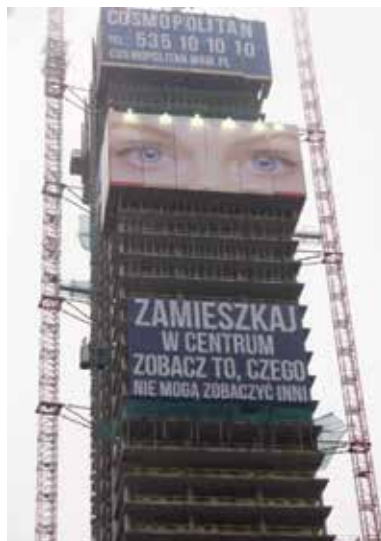
Advertising banner on the Cosmopolitan building, plac Grzybowski, Warsaw, November 2012