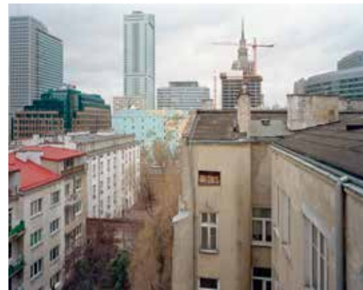
Elżbieta Janicka, Wojciech Wilczyk, Inne Miasto : Widok ze Żłotej 62 w kierunku wschodnim — 19 marca 2011, podwórko z fragmentem muru getta