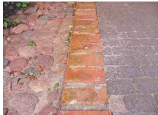
Elżbieta Janicka, Festung Warschau , podwórko między Sienną 55 a Złotą 62, po prawej dawna „strona aryjska”, po lewej dawne getto — sierpień 2011