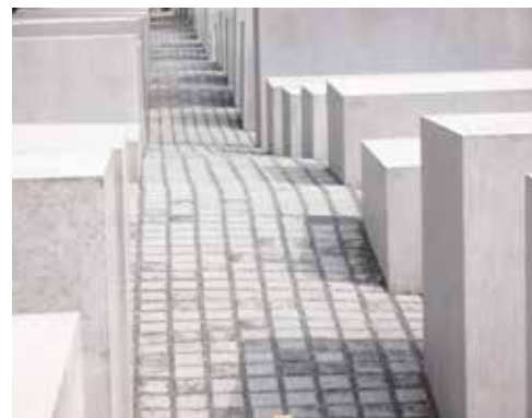
Peter Eisenman, Pomnik Pomordowanych Żydów Europy, 2003–2005, Berlin, fot. G. Świątek